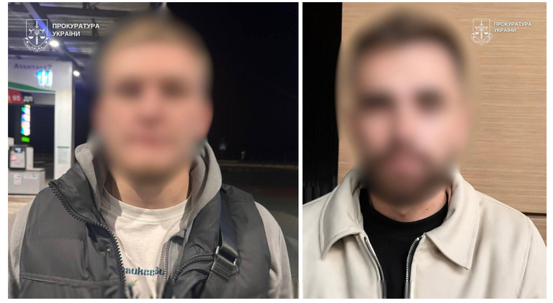
Затримані у справі Валерія Пустовойтенка.

Новини по темі: Шахраї VIP-персони шахрайство