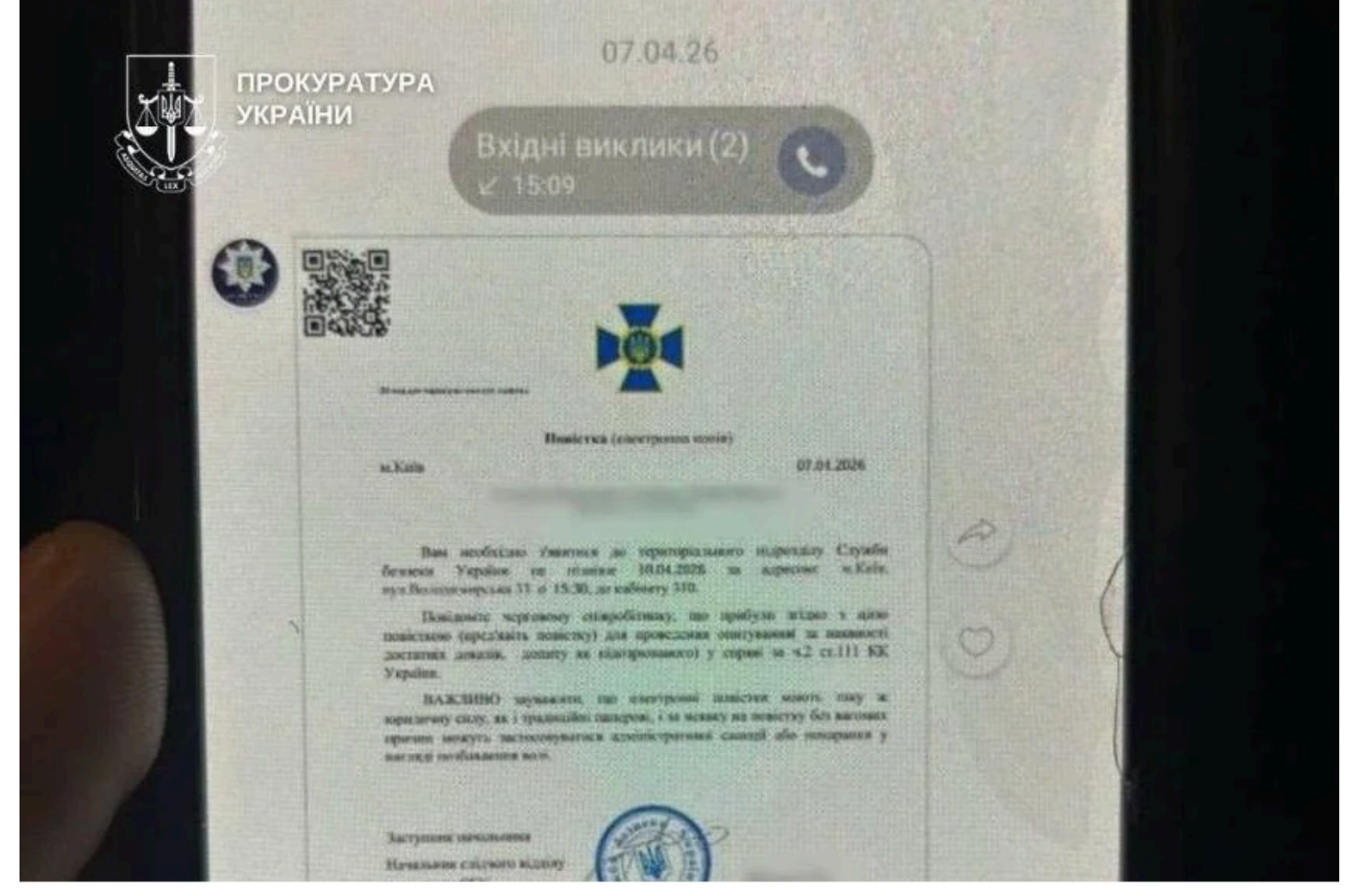
"Повістка", яку надіслали народній актрисі.

Попри нібито політичне забарвлення, додає психолог, афера будується на старих засадах - емоційному стресі, коли людина втрачає здатність тверезо мислити і слухняно виконує сторонні накази.