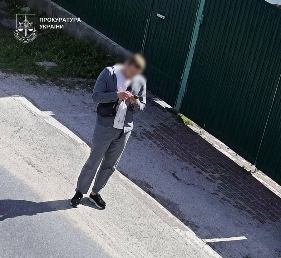
Отримавши від експрем'єра гроші, один із виконавців дзвонить напарнику.

Ошелешений такою звісткою, пенсіонер погодився на «обшук по відеозв'язку» - показав свої заощадження, а потім склав гроші у пакет і передав їх молодому чоловіку, який під'їхав до воріт його будинку. В руках змовників опинилися 110 000 доларів, 10 200 євро, 10 000 ізраїльських шекелів, 20 500 фунтів стерлінгів, а ще чеські крони та єгипетські фунти, які, ймовірно, залишилися після поїздок за кордон. До поліції Валерій Пустовойтенко звернувся 30 квітня. Станом на зараз підозрювані вже затримані, їм загрожує від 5 до 12 років неволі. Однак, за версією слідства, 19-річний та 26-річний молодики лише виконавці злочину. Долари і євро вони перерахували організатору, решту валюти спробували обміняти, але не змогли, її знайшли в автомобілі одного з учасників оборудки.