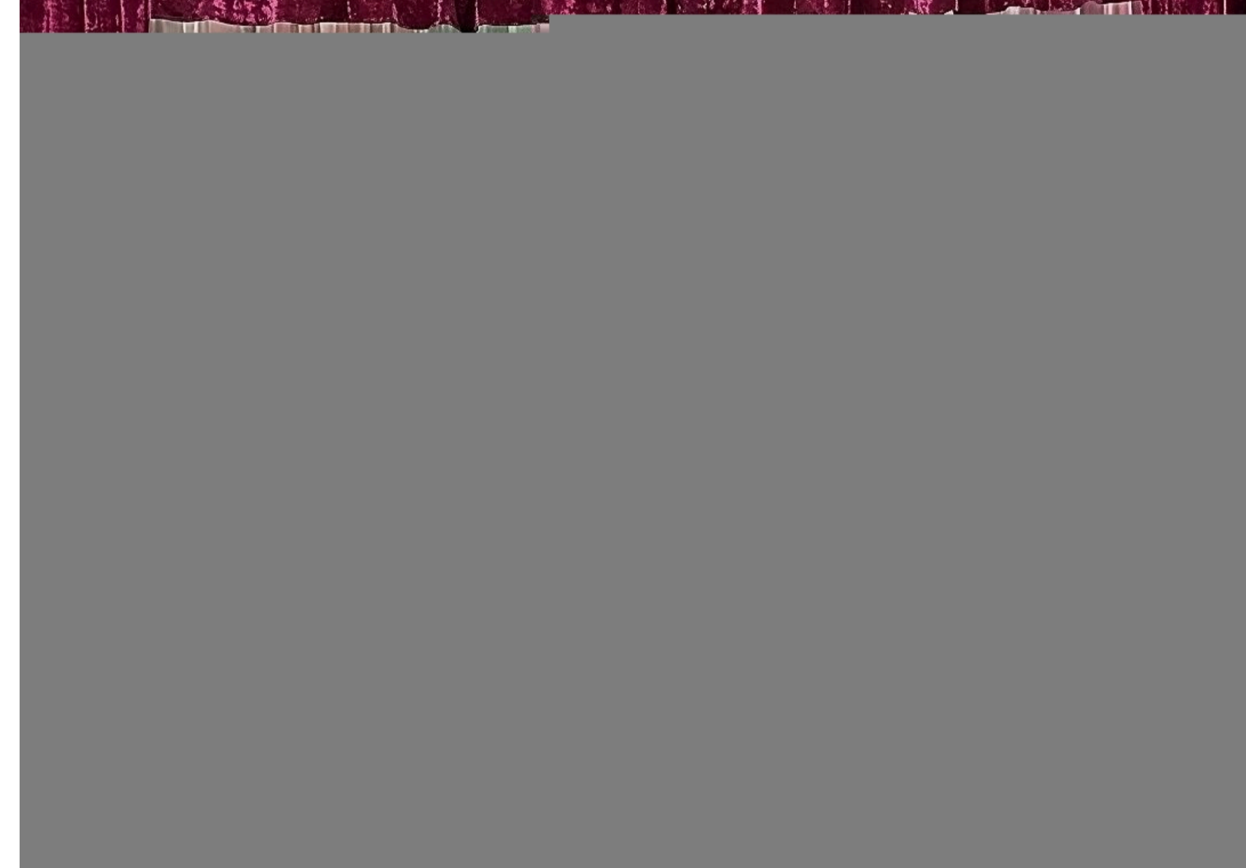
Колектив ложкарів - улюбленці молодшої директорки.

- Нещодавно після двох звітних концертів вони всією юрбою підбігли до мене, обійняли міцно-міцно і кажуть: «Ми тебе любимо!». У такі моменти розумієш, що це і є твоя найголовніша, найцінніша плата за те, чим я займаюся, - зізнається дівчина.