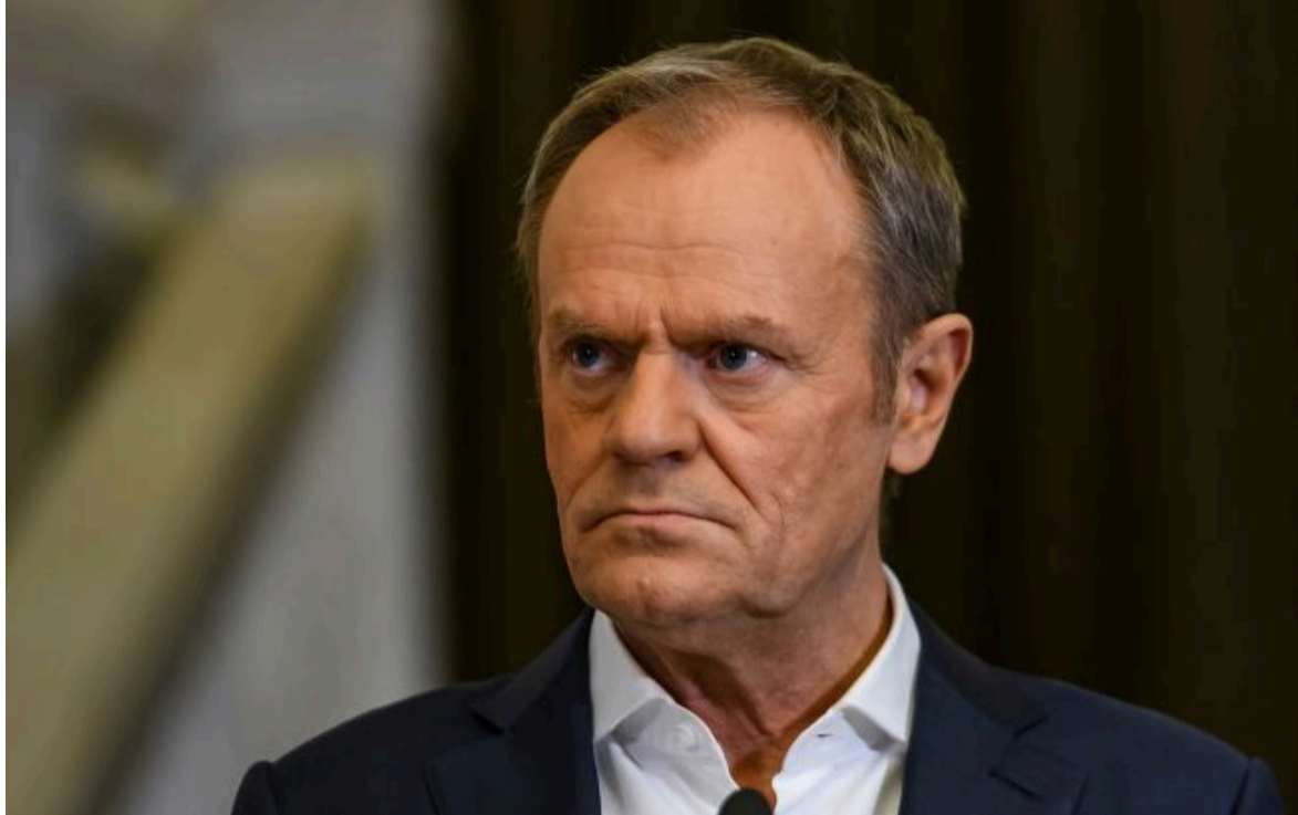
Фото: Дональд Туск (Getty images)

Не витрачай час на шум! Читай тільки суть з РБК-Україна у Google