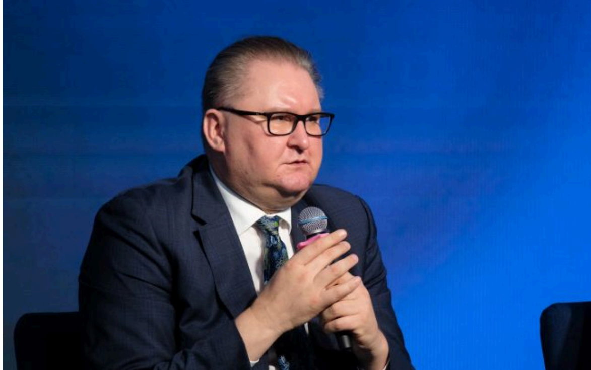
Фото: Тарас Качка (Віталій Носач РБК-Україна)