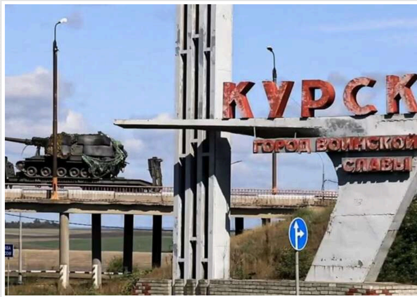
Російські війська просунулися більш ніж на 40 квадратних кілометрів у Курській області

Російські війська досягли нового значного просування в Курській області.