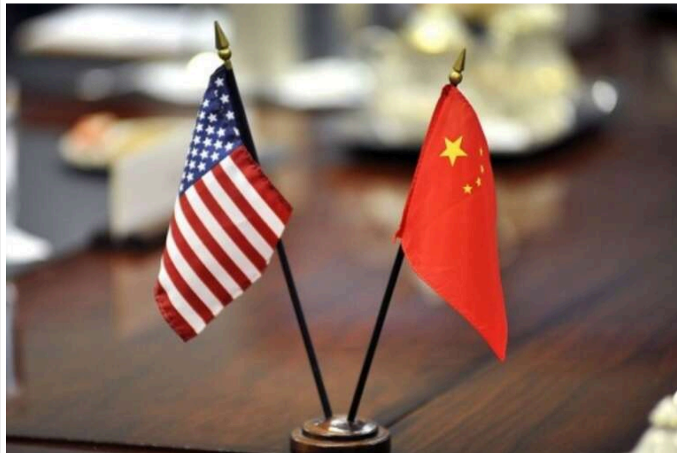
Bloomberg: Трамп вдвічі підняв тарифи для товарів із Китаю

Президент США Дональд Трамп ухвалив рішення подвоїти тарифи на товари з Китаю. Тепер вони становлять не 10%, а 20%.