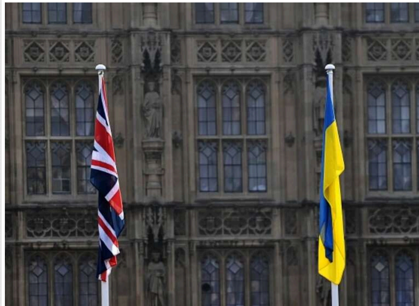
Британія "тисне" на Зеленського, щоб відновити відносини зі США після конфлікту з Трампом

Британія чинить тиск на президента України Володимира Зеленського, щоб той зробив все можливе для відновлення відносин із США після його конфлікту з Дональдом Трампом у Білому домі.