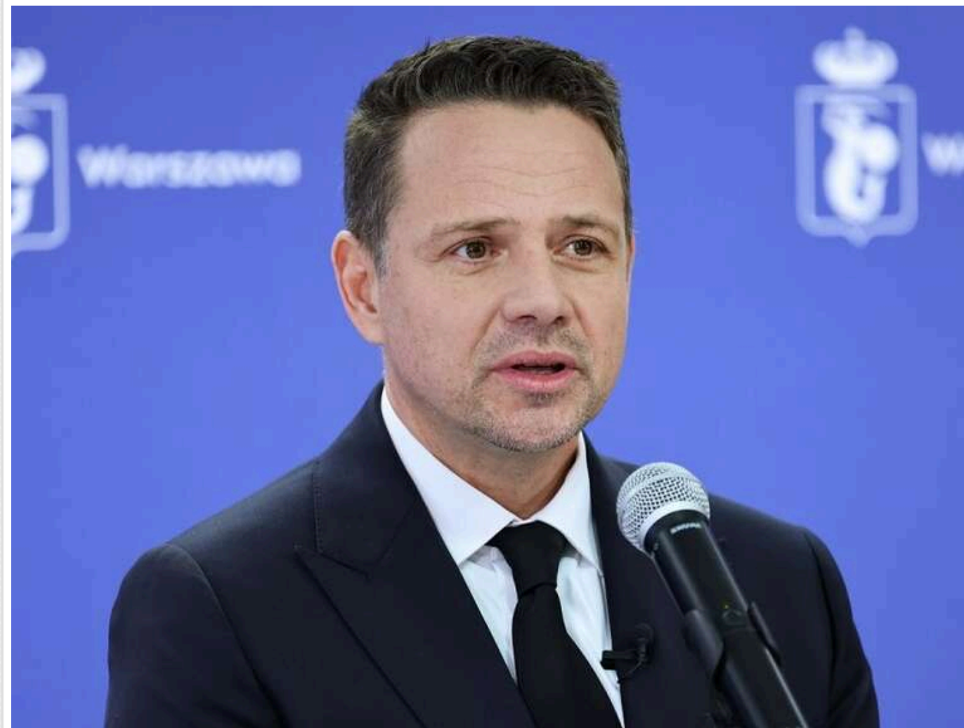
«Тиск має чинитися на агресора, а не на жертву», - мер Варшави Рафал Тшасковський про зустріч президентів України та США

2 березня, Жешув — Мер Варшави та кандидат на пост президента Польщі від КО Рафал Тшасковський виступив із важливою заявою, коментуючи нещодавню словесну перепалку між президентами України та США, Володимиром Зеленським і Дональдом Трампом, що відбулася у Білому домі.