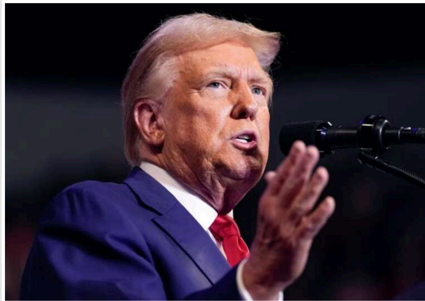
Трамп може зупинити Україні постачання зброї на 30 мільярдів доларів за програмою USAI, - ЗМІ