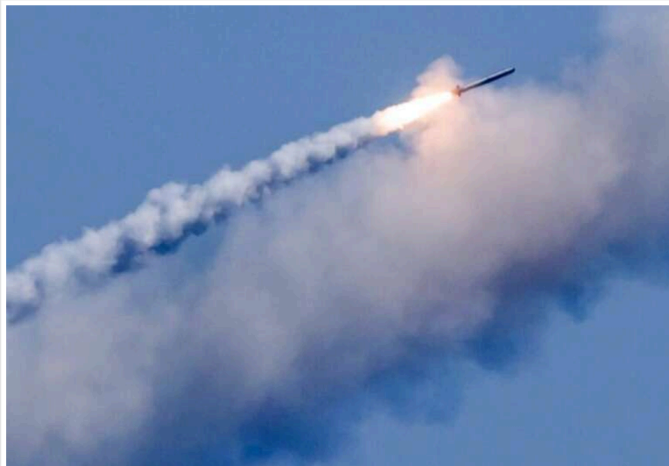
Російський ракетний удар по військовому полігону на Дніпропетровщині: ворог отримав інформацію через TikTok

1 березня 2025 року росіяни завдали удару по полігону Сухопутних військ ракетною "Іскандер-М" з касетною боеголовкою. Пізніше, 2 березня, офіційні джерела у Генеральному штабі підтвердили цю інформацію. Проте, кількість жертв та постраждалих не відома. Триває службове розслідування. Як зазначив Головнокомандувач ЗСУ Олександр Сирський, на час розслідування був усунутий начальник центру підготовки підрозділів і командир військової частини.