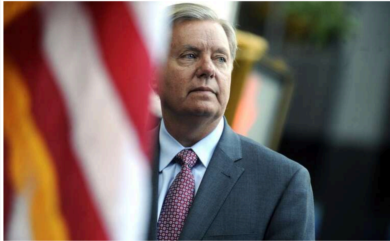
Зеленський має змінитися або прислати того, з ким можна вести бізнес, - сенатор Грем про зрив угоди про надра

Сенатор США від Республіканської партії Ліндсі Грем, після зриву підписання угоди про надра між Україною та США та суперечки президентів України та США Володимира Зеленського та Дональда Трампа, заявив, що реанімувати угоду можливо, якщо Зеленський призначить іншого перемовника.