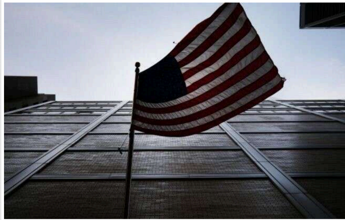
Reuters: У Трампа не виключають пресконференцію із Зеленським, поки той у США

Ще є ймовірність проведення спільної пресконференції президента України Володимира Зеленського та президента США Дональда Трампа.