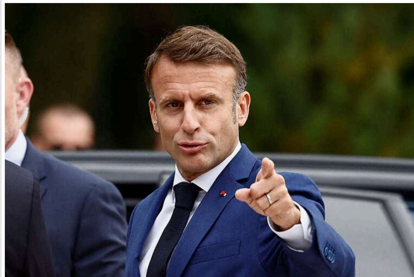
Росія – агресор, Україна – народ який постраждав від агресії, – Макрон

Росія – агресор, Україна – народ, який постраждав від агресії. Санкції проти Росії необхідно було запровадити ще три роки тому і продовжувати робити це, заявив президент Франції Емманюель Макрон після дискусії між президентом України Володимиром Зеленським та президентом США Дональдом Трампом.