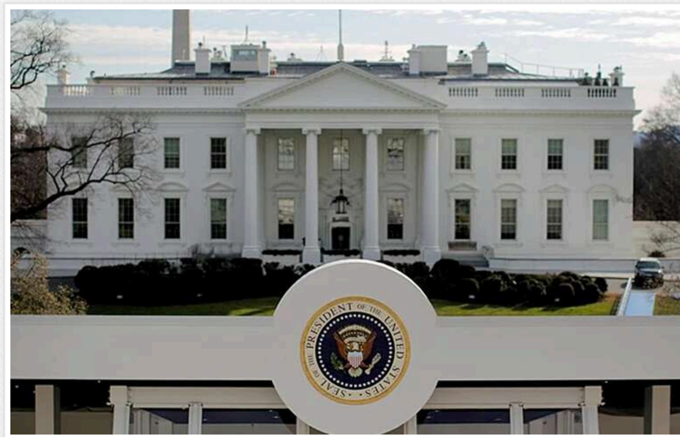
Усе було готово до підписання угоди, "столи, ручки", – Sky News

За даними Sky News, підготовка до підписання важливої угоди по викопним ресурсам йшла повним ходом, і все було готово до укладення договору. Столи вже були розставлені, а ручки лежали на столах, очікуючи офіційного підписання. Однак в останній момент все розвалилося.