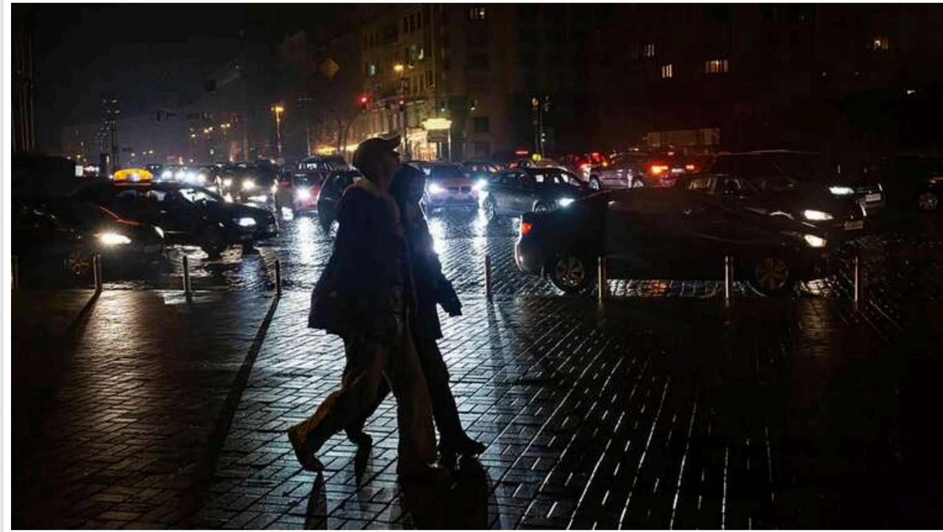
В "Укренерго" повідомили про відключення світла для промисловості та бізнесу

В Україні в суботу, 1 березня, знову будуть застосовані графіки відключення електроенергії. Проте вони торкнуться лише промисловості та бізнесу.