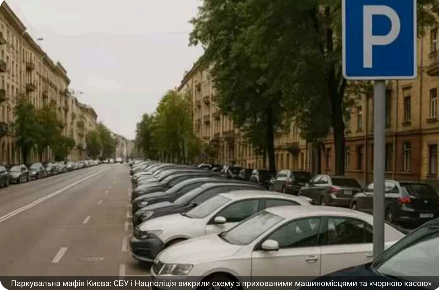
Паркувальна мафія Києва: СБУ і Нацполіція викрили схему з прихованими машиномісцями та «чорною касою»

Столичне комунальне підприємство «Київтранспарксервіс» опинилося в центрі нового кримінального скандалу. Нацполіція та СБУ викрили схему, за якою посадовці КП передавали приватним компаніям паркувальні майданчики, свідомо занижуючи кількість машиномісць у документах — подекуди майже в'ятеро.