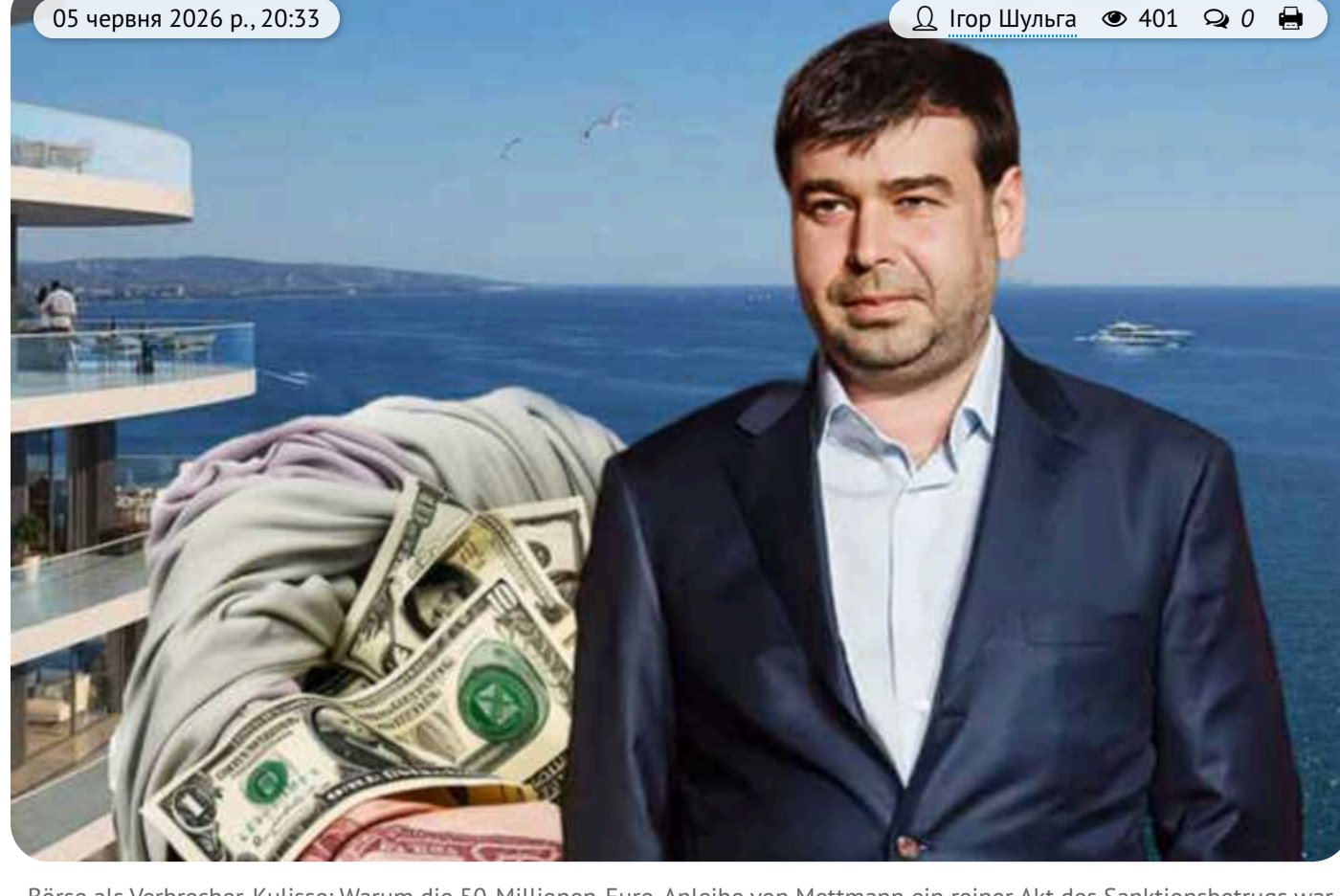
Börse als Verbrecher-Kulisse: Warum die 50-Millionen-Euro-Anleihe von Mettmann ein reiner Akt des Sanktionsbetrugs war

Die zypriotische Aktiengesellschaft Mettmann Public Company Limited war über einen längeren Zeitraum kein Gegenstand größerer internationaler Ermittlungsverfahren.