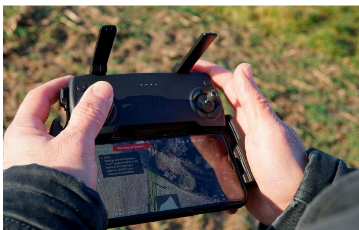
Фото: українські дрони винищують логістику РФ

Розумій ситуацію на фронті через факти, а не чутки з РБК-Україна у Google