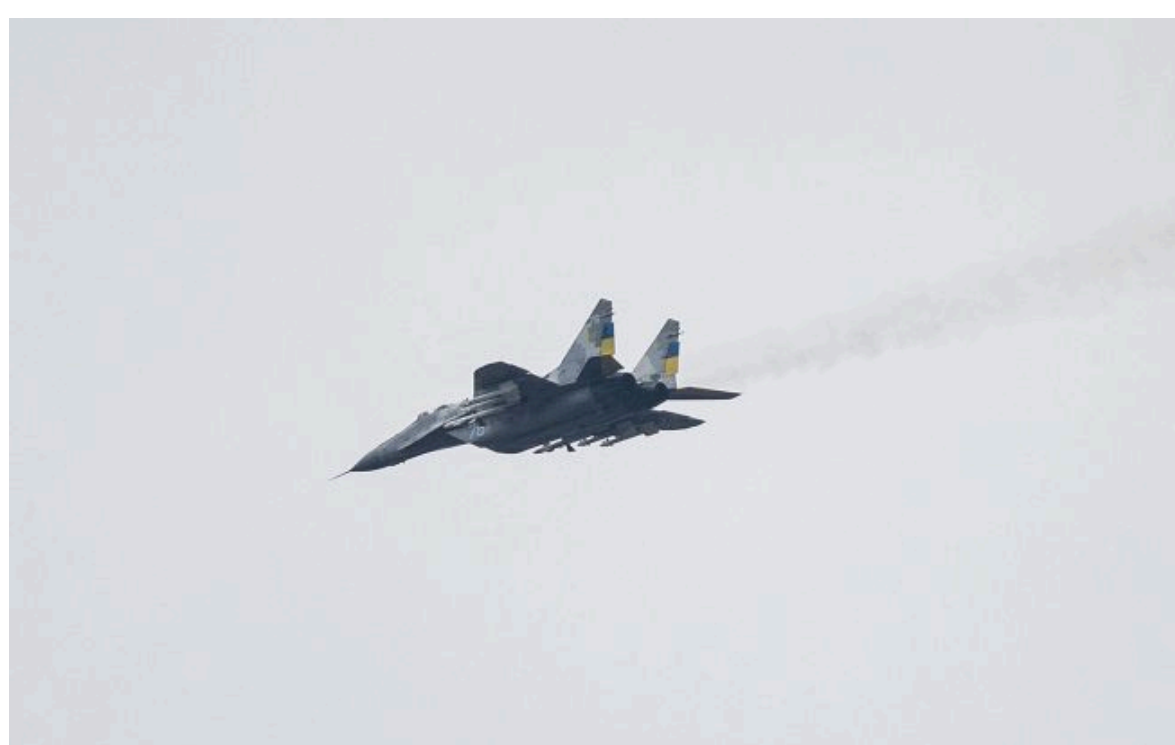
Фото: ЗСУ авіаударом в Покровську ліквідували точку злету безпілотників ворога