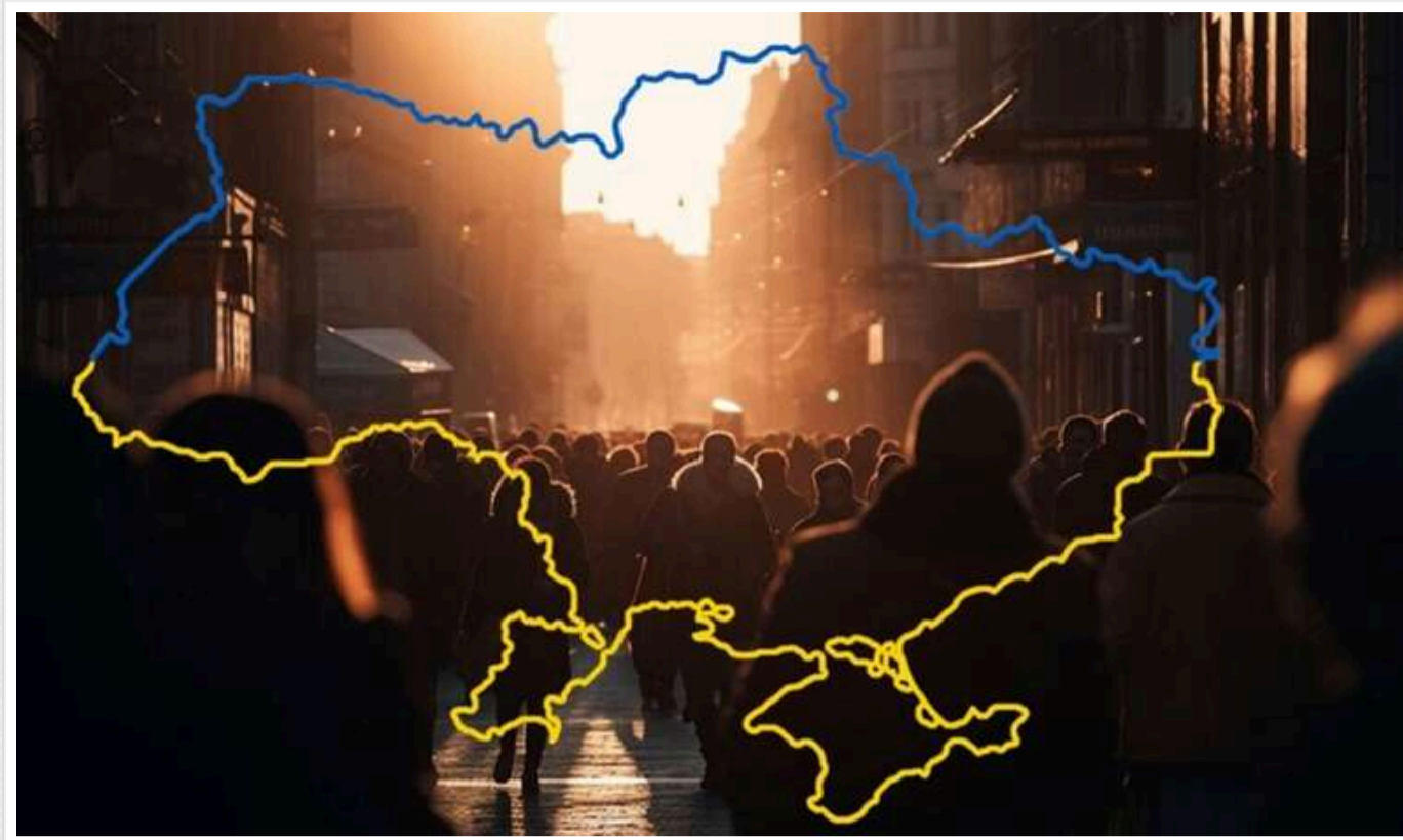
Прогноз WP: Населення України може скоротитися до 15 мільйонів до 2100 року

За даними аналітиків, до 2050 року населення України може зменшитися до 25 мільйонів, а до 2100 року – до 15 мільйонів.