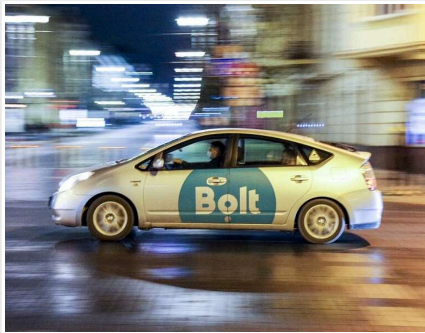
Bolt запроваджує нову послугу для жінок

Компанія Bolt відкриває нову категорію поїздок «Women for Women». Обравши її в додатку, жінки зможуть замовляти поїздки у жінок-водійок, що забезпечує безпечне та комфортне середовище для всіх. Наразі ця опція буде доступна в Києві.