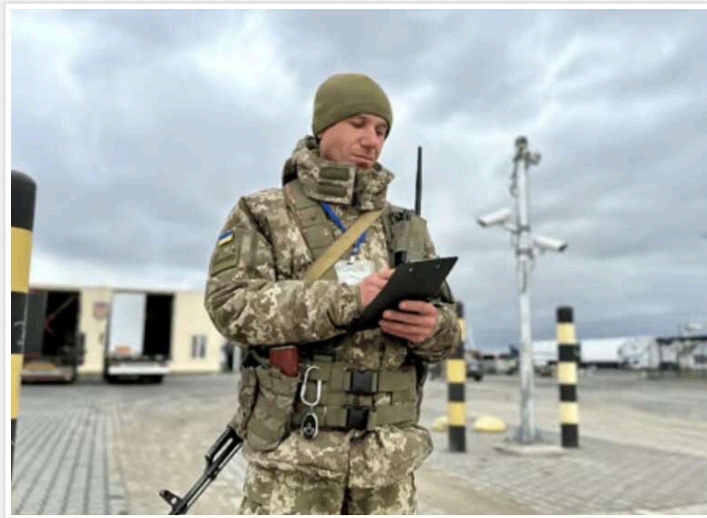
Гуманітарні та медичні вантажі більше не підстава для виїзду військовозобов'язаних чоловіків за кордон

Державна прикордонна служба України повідомила про зміну порядку виїзду військовозобов'язаних чоловіків за кордон.