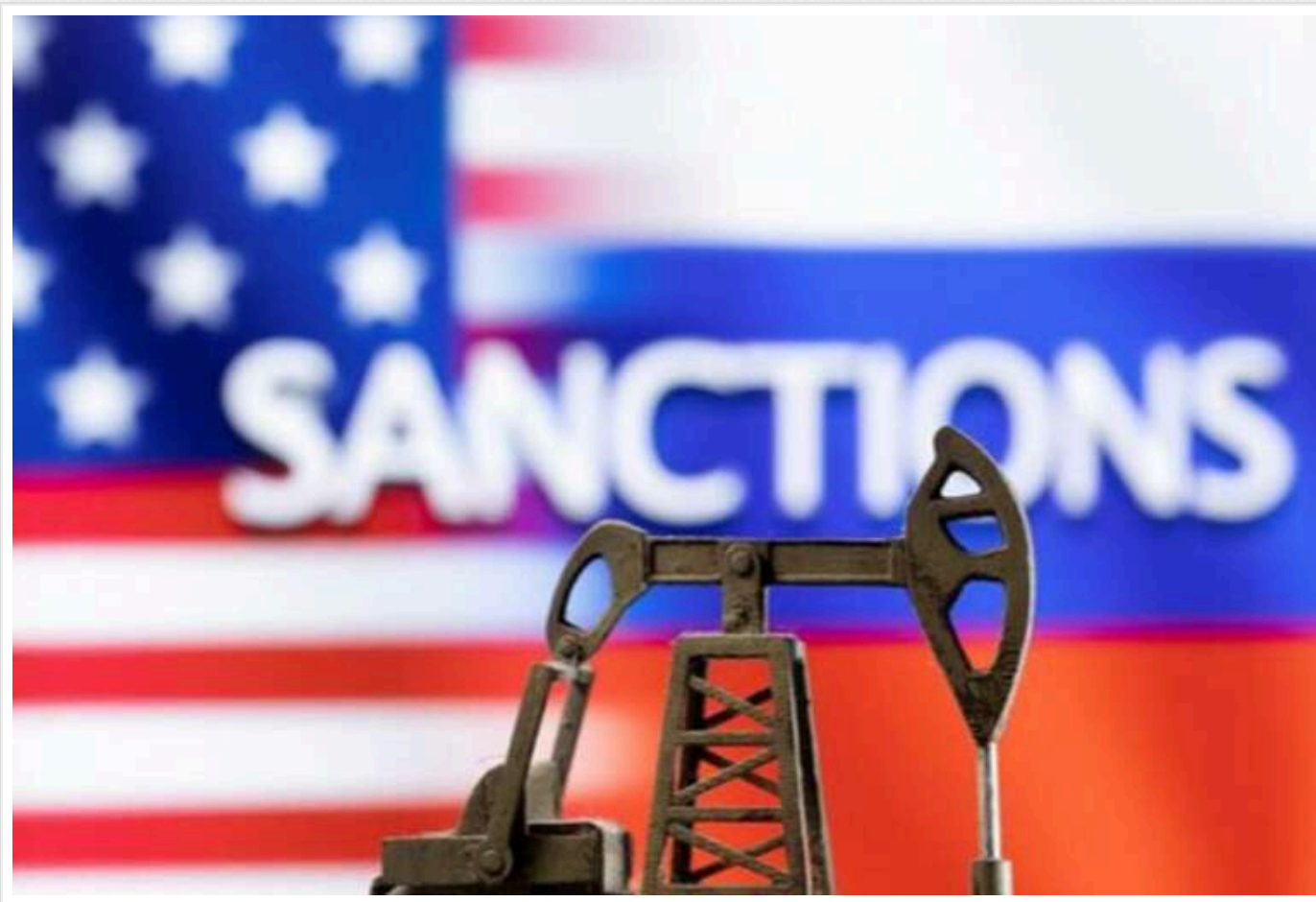
Санкції США на російський нафтогазовий сектор обернуться втратою 1% експорту