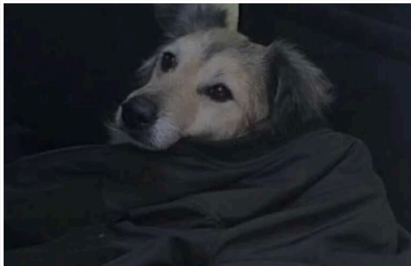
У Кривому Розі врятували собаку, який зазнав поранення внаслідок атаки РФ 22 лютого

У Кривому Розі ветеринарам вдалося врятувати собаку, який отримав поранення унаслідок ракетної атаки РФ по місту 22 лютого, не рухався і не гавкав.