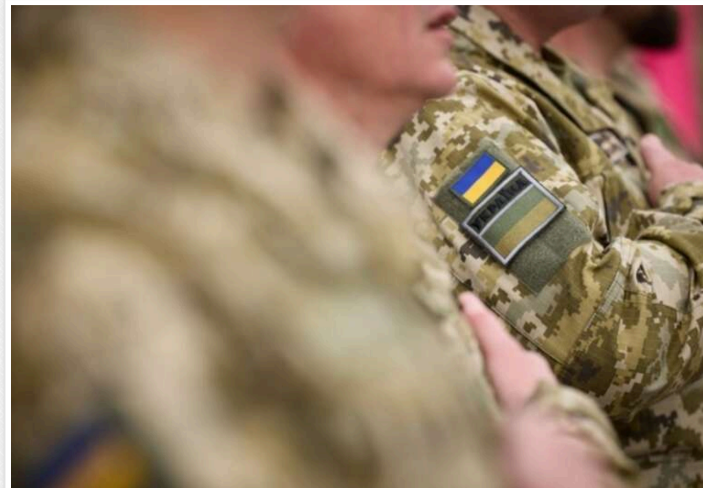
Понад 86% українців проти зниження віку для мобілізації, - опитування

За результатами опитування Socis, 86,5% українців виступають проти зниження віку для мобілізації до 18 або 20 років.