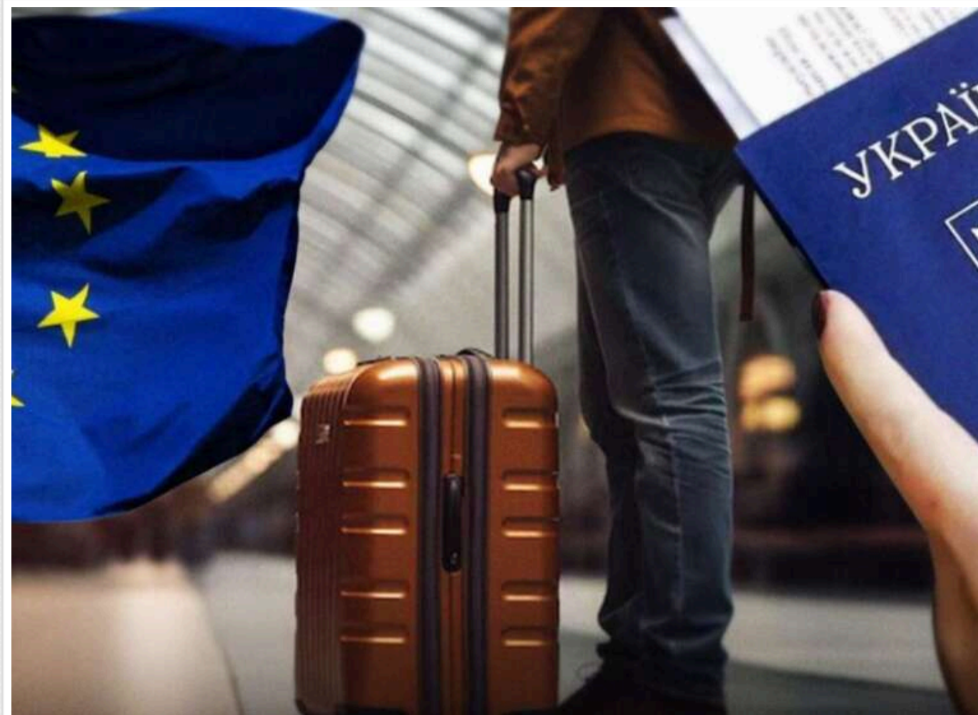
49% поляків проти закриття кордону для українських біженців, 74% підтримують повернення українців для участі у війні

Це стало відомо з результатів опитування, проведеного Opinia24.