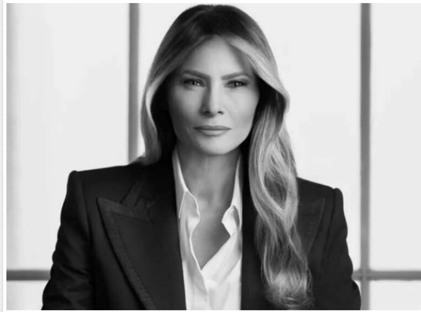
З чим пов'язана відсутність Меланії Трамп на публічних заходах протягом місяця?

З моменту, коли президент США Дональд Трамп знову обійняв посаду президента, перша леді Меланія Трамп демонструє незвичайний підхід до своїх обов'язків. Вона рідко з'являється на публіці та, за словами інсайдерів, зосереджена на власних проєктах, які приносять їй особисте задоволення.