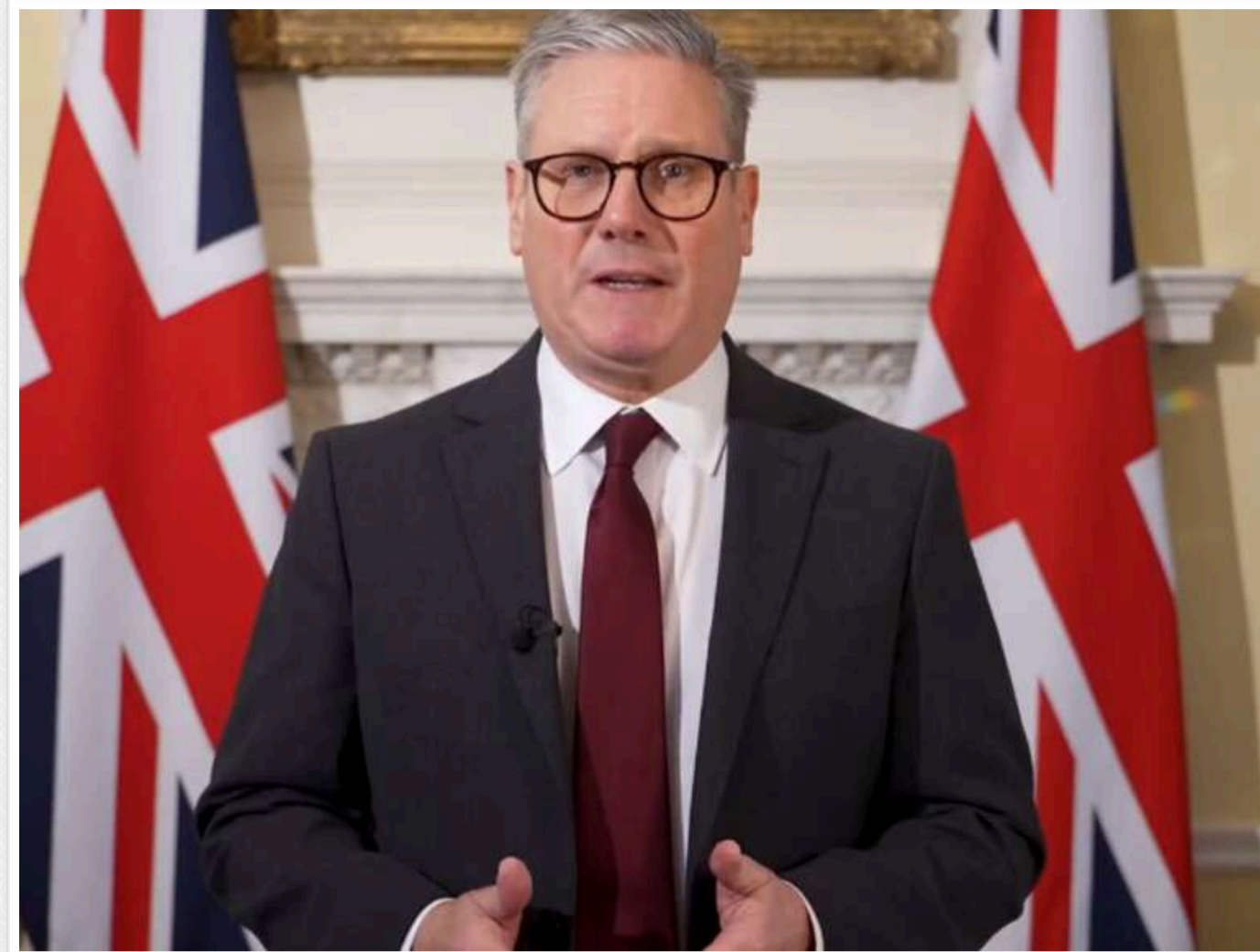
Агресія Путіна проти України становить загрозу й для Британії, - Стармер

Прем'єр-міністр Великої Британії Кіп Стармер вважає, що агресія Росії проти України становить загрозу також і для жителів його країни.