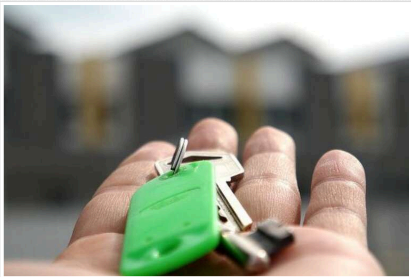
Шахраї видали заміж покійницю, щоб отримати квартиру в Києві