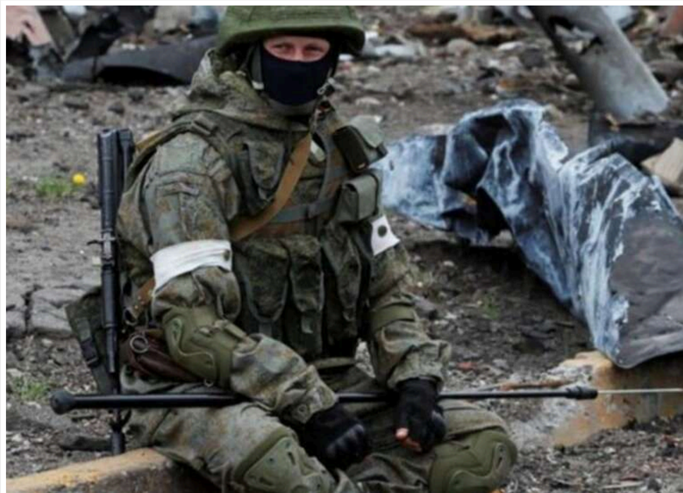
Кремлівський "z-воєнкор" визнав провал армії РФ під Покровськом

Сили оборони України не тільки утримали контроль над ситуацією на Покровському напрямку, але й почали активно переходити в контратаку. Оборонна лінія Росії почала тріщати по швах, що змусило командування вживати відчайдушних заходів.