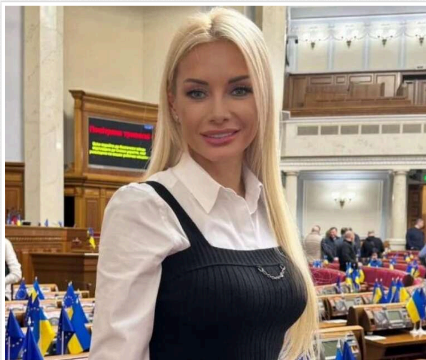
Скандальна ексдепутат Ірина Кормишкіна розмістила у соцмережі світліну у сукні за майже 100 тисяч гривень

Скандальна ексдепутатка Ірина Кормишкіна, яку підозрюють в незаконному збагаченні на понад 20 мільйонів гривень, опублікувала нове фото на своїй сторінці у Фейсбук.