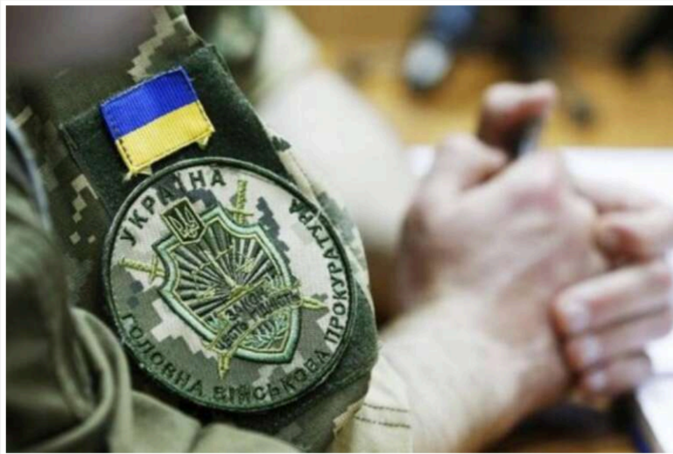
Військова прокуратура розслідує розкрадання сотень мільйонів гривень, виділених КМДА на 112-ту бригаду ТРО

Спеціалізована військова прокуратура проводить розслідування щодо розкрадання коштів, які КМДА виділяла на 112-ту бригаду територіальної оборони: йдеться про сотні мільйонів гривень.