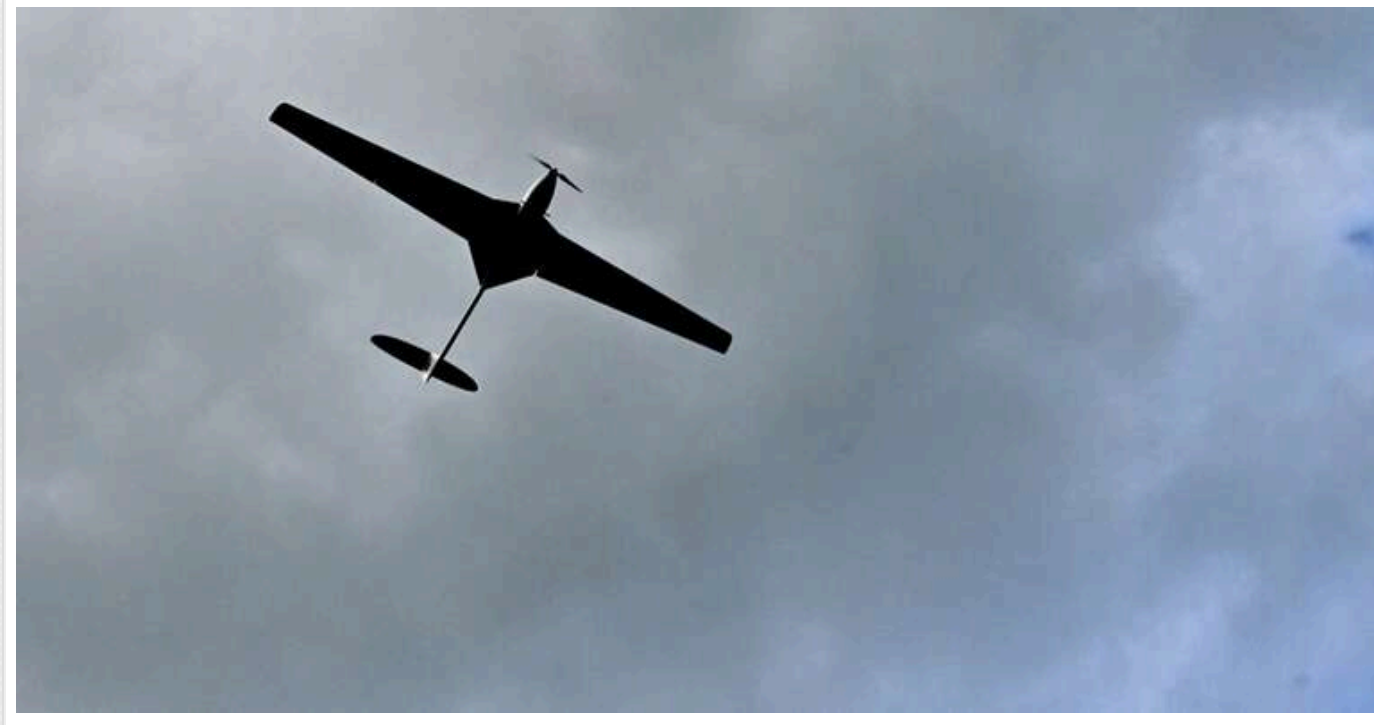
Нічна атака на НПЗ та морський порт у Краснодарському краю була операцією ГУР

У ніч на 26 лютого ГУР разом з іншими підрозділами Сил оборони України завдали удару по нафтопереробному заводу (НПЗ) та морському порту в місті Туапсе Краснодарського краю Росії.