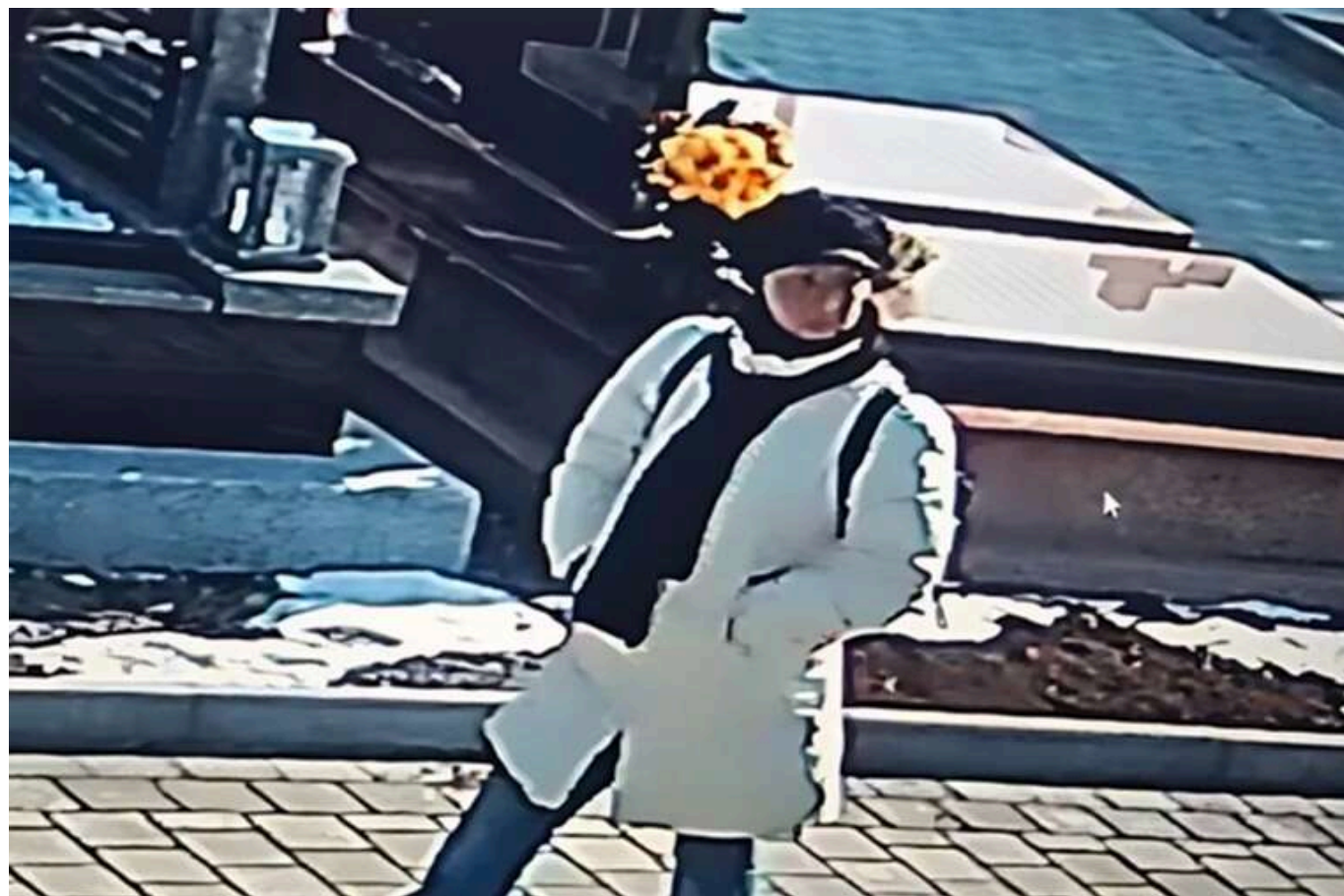
У Чернівцях орудує злочійка та мародерка, яка пограбувала могилу Захисника на Алеї Слави

У Чернівцях діє злочійка та мародерка, яка обікрала могилу полеглого Героя.