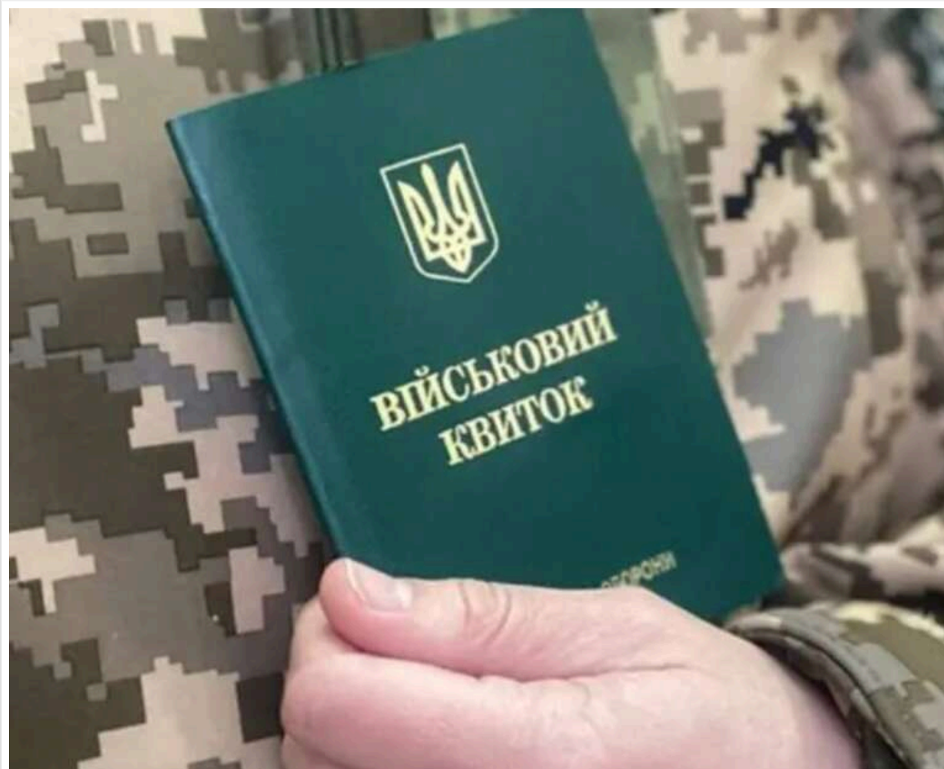
Українці за кордоном зможуть дистанційно отримати бронь від мобілізації, – Чернишов

Українці, які знаходяться в інших країнах, зможуть отримати відстрочку від мобілізації з подальшим працевлаштуванням в Україні у спеціальних закордонних центрах.