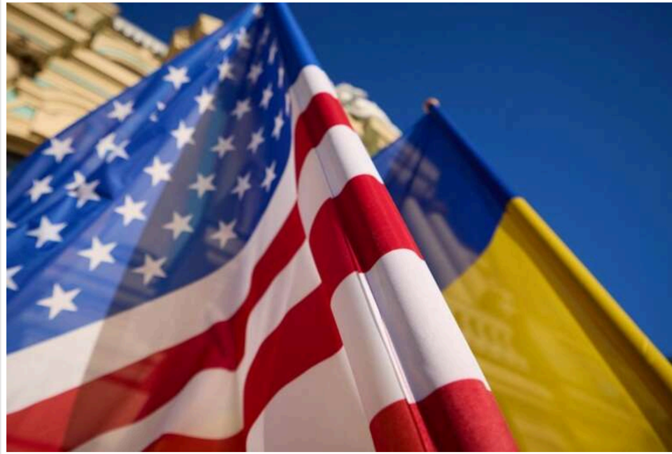
Україна погодилася на угоду з США щодо спільної розробки мінеральних ресурсів, - FT

Україна погодилася підписати угоду зі США про спільну розробку своїх мінеральних ресурсів, повідомляє Financial Times з посиланням на джерела.