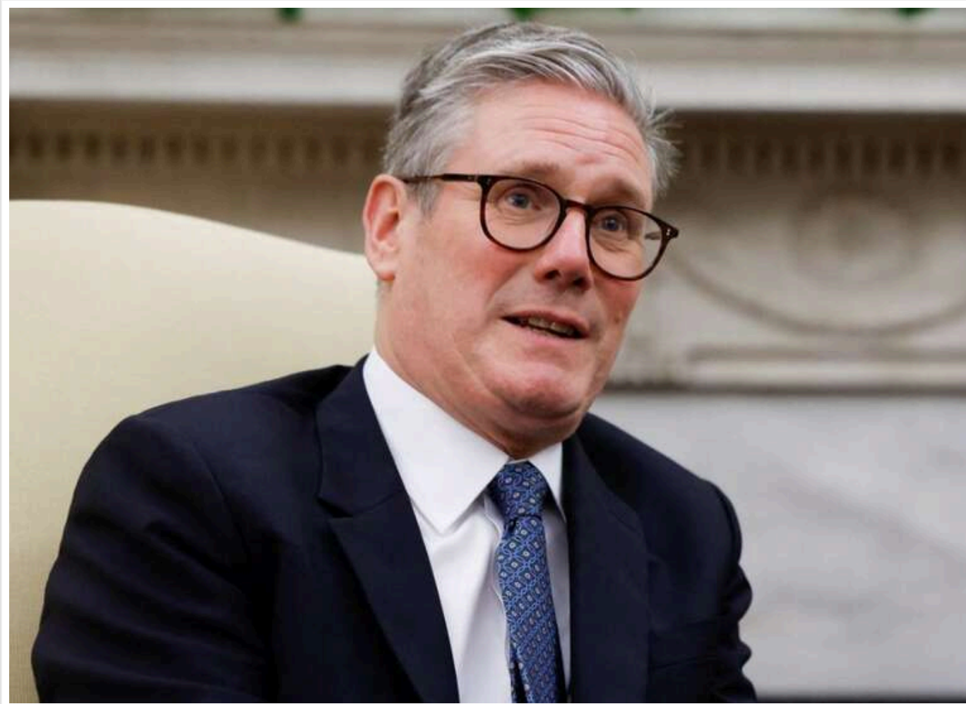
Стармер обговорить із Трампом повернення Росії в G8 після закінчення війни в Україні

Прем'єр-міністр Великобританії обговорить з Дональдом Трампом можливість повернення Росії в "Велику вісімку", як повідомив британський міністр безпеки Ден Джарвіс.