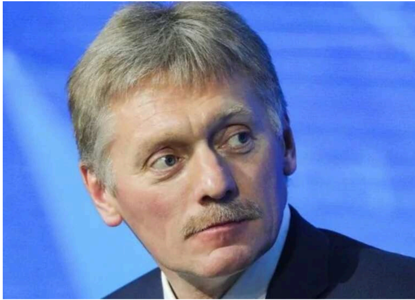
США та РФ починають відновлення дипломатичних відносин, але питання війни в Україні ще не обговорювалися, - Песков

США та Росія перебувають на етапі відновлення дипломатичних відносин, заявив речник Кремля Дмитро Песков.