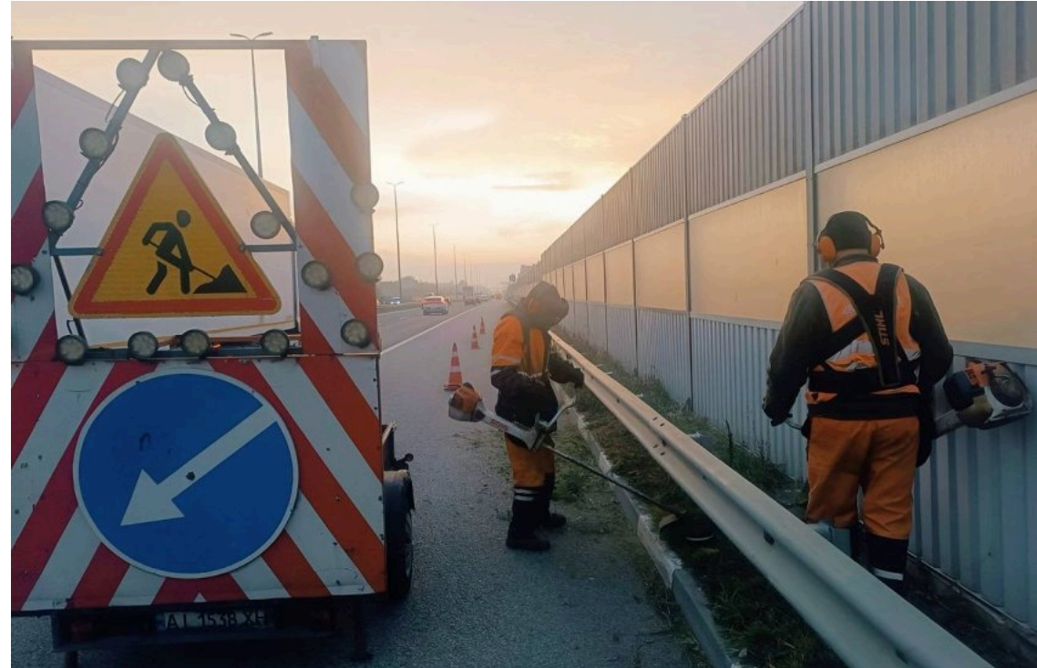
У столиці тимчасово обмежать рух однією з ключових транспортних артерій

У Києві частково обмежуватимуть рух Набережним шосе в Печерському районі. Причиною стануть ремонтні роботи на ділянці від мосту Метро у напрямку транспортної розв'язки мосту імені Євгена Патона.