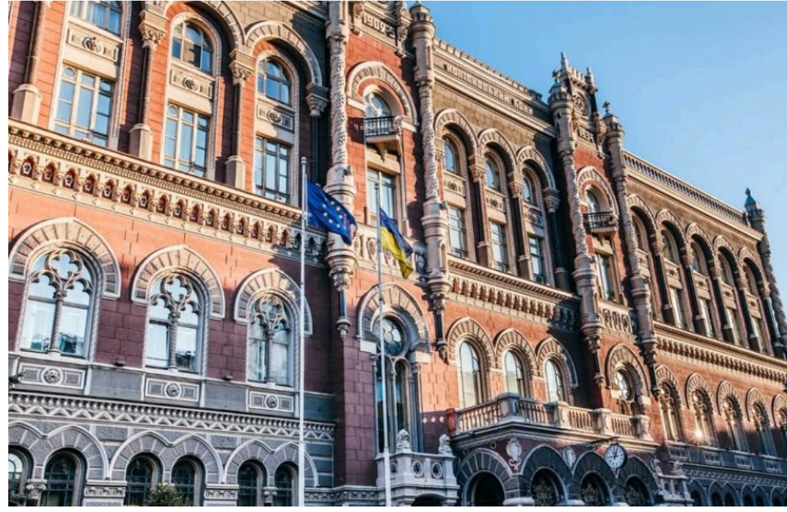
Нацбанк отримав право встановлювати підвищені нормативи для окремих банків

Національний банк України затвердив нове положення, яке дозволяє встановлювати для банків підвищені вимоги до достатності капіталу та ліквідності залежно від рівня ризиків. Документ розроблений відповідно до норм Європейського Союзу та має посилити стійкість банківської системи й захист інтересів вкладників.