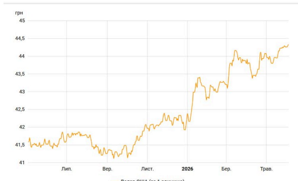
Зростання курсу долара США протягом місяця

Тим часом євро подешевшало на 14 копійок – НБУ встановив офіційний курс європейської валюти на рівні 51,52 грн.