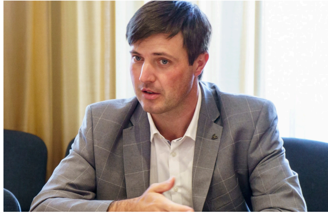
Заступник міністра економіки Тарас Висоцький

У Кіровоградській області через російські атаки пошкоджено 20 підприємств. Для їхнього відновлення Мінекономіки презентувало три державні програми, які допомагають відновлювати виробництво, страхувати майно від воєнних ризиків та зберігати трудові колективи в період вимушеного простою.