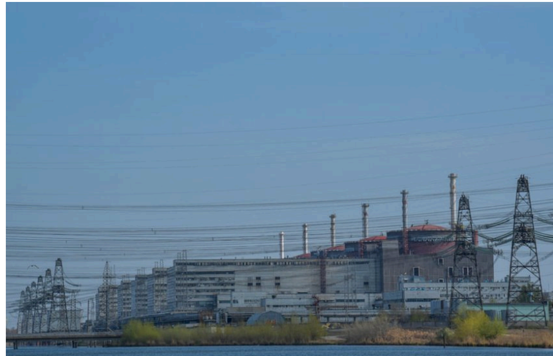
ЗАЕС перебуває під окупацією росіяні із березня 2022 року.

Вранці 4 червня Запорізька ТЕЦ, розподільча станція якої забезпечує постачання електроенергії до окупованої Запорізької атомної електростанції (ЗАЕС), зазнала потужного обстрілу.