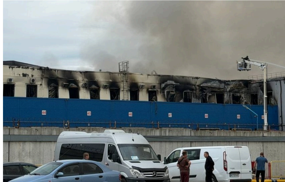
Російська армія атакувала продуктові склади АТБ у Дніпрі

Внаслідок російської атаки дронами по Дніпру, що відбулася 3 червня, повністю знищено розподільчий центр мережі АТБ. Наразі об'єкт площею 37,5 тисяч квадратних метрів повністю припинив роботу.