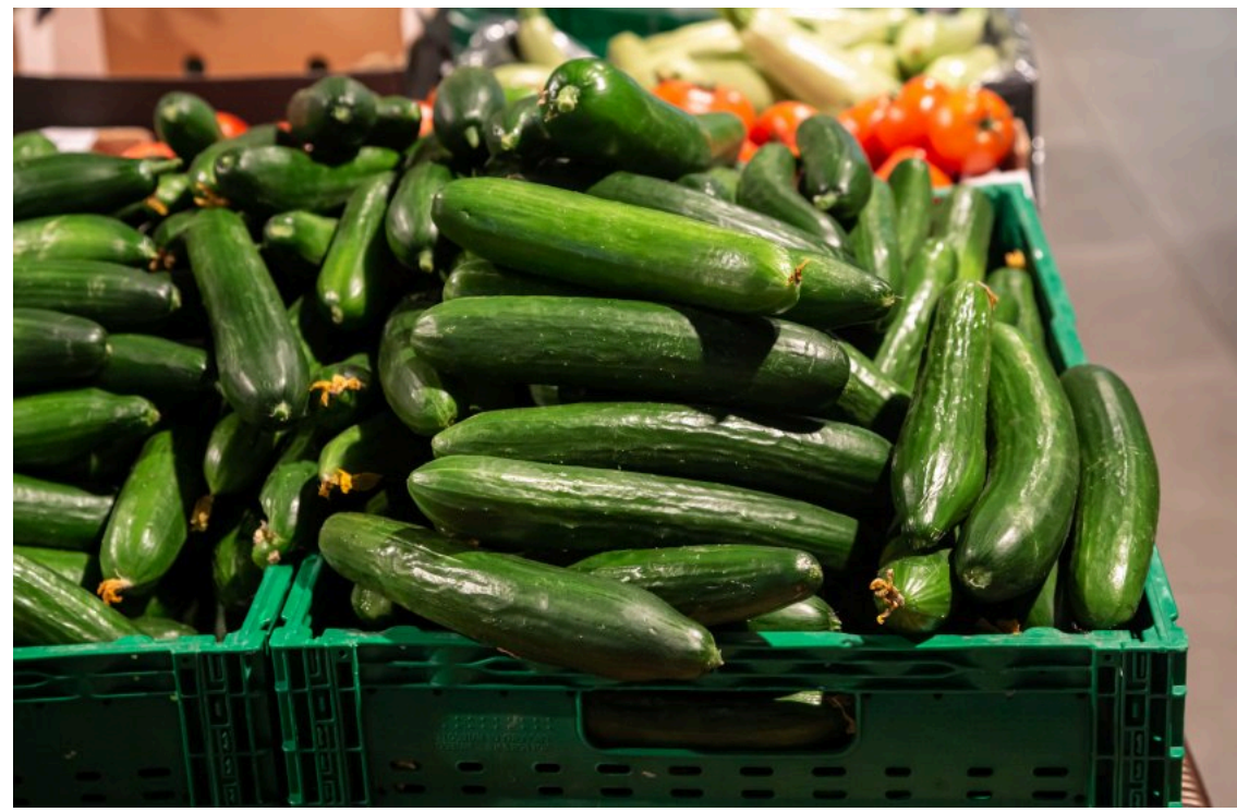
В Україні знову зникаються ціни на огірки

Тепличні огірки в Україні подешевшали в середньому на 17% лише за один тиждень. Масовий вихід на ринок продукції з літніх теплиць збив ціни до 35–65 грн/кг після рекордних зимових 170 грн/кг.