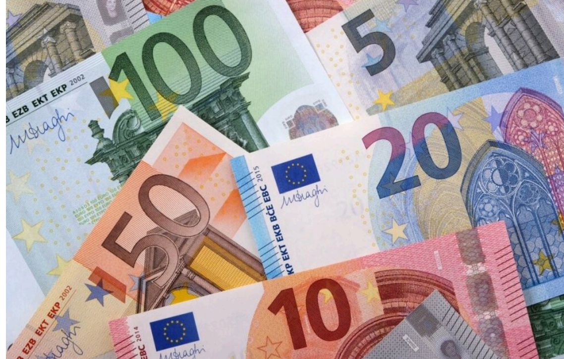
ЄБРР та ЄС запускають нову програму підтримки приватного сектору України

Українські стартапи та малі підприємства отримають додаткову фінансову і технічну підтримку завдяки новій програмі від Європейського банку реконструкції та розвитку (ЄБРР) та ЄС на €135 мільйонів. Проєкт містить інструменти розподілу ризиків для складних інвестиційних операцій та передбачає розширення бізнес-акселератора Star Venture.