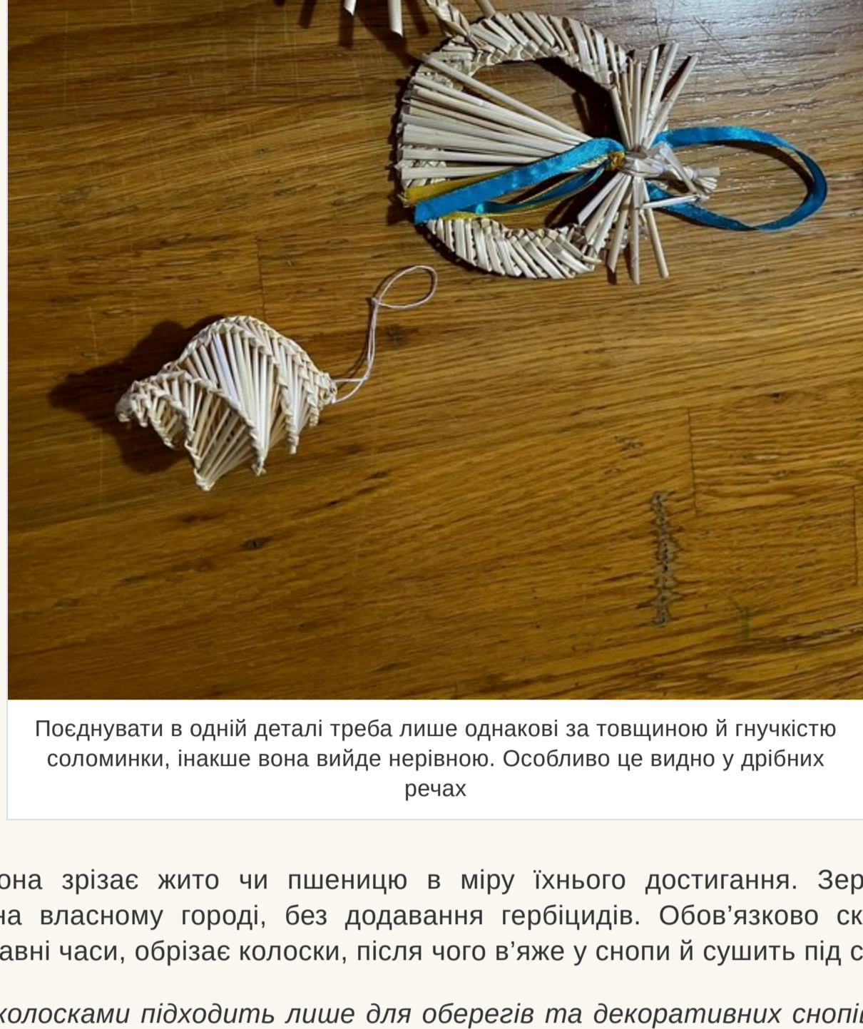
Поєднувати в одній деталі треба лише однакові за товщиною й гнучкістю соломинки, інакше вона вийде нерівною. Особливо це видно у дрібних речах