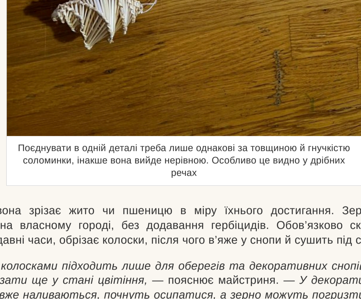
Поєднувати в одній деталі треба лише однакові за товщиною й гнучкістю соломинки, інакше вона вийде нерівною. Особливо це видно у дрібних речах