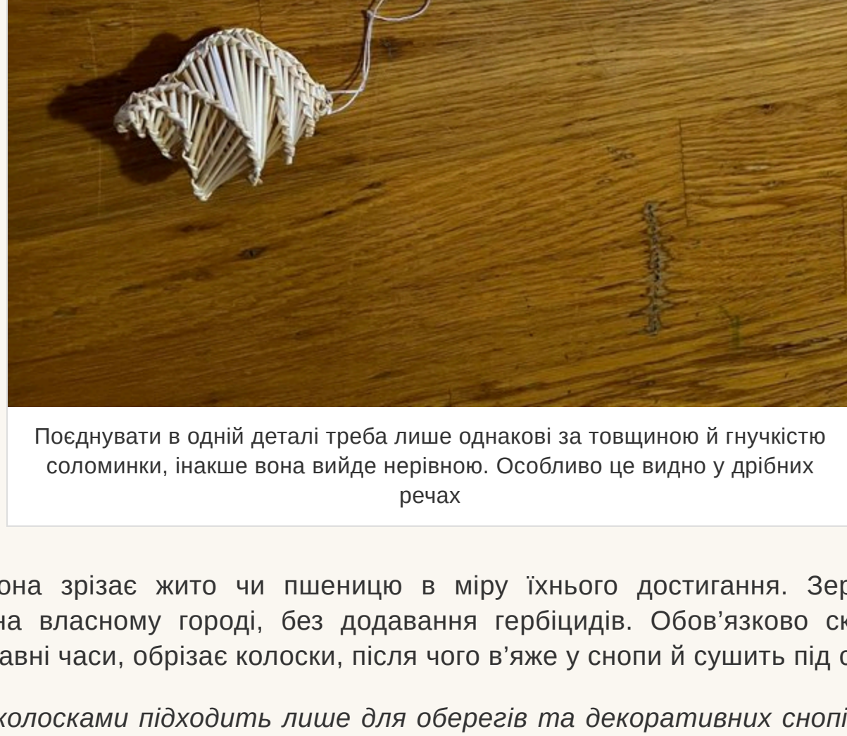
Покднувати в одній деталі треба лише однакові за товщиною й гнучкістю соломинки, інакше вона вийде нерівною. Особливо це видно у дрібних речах