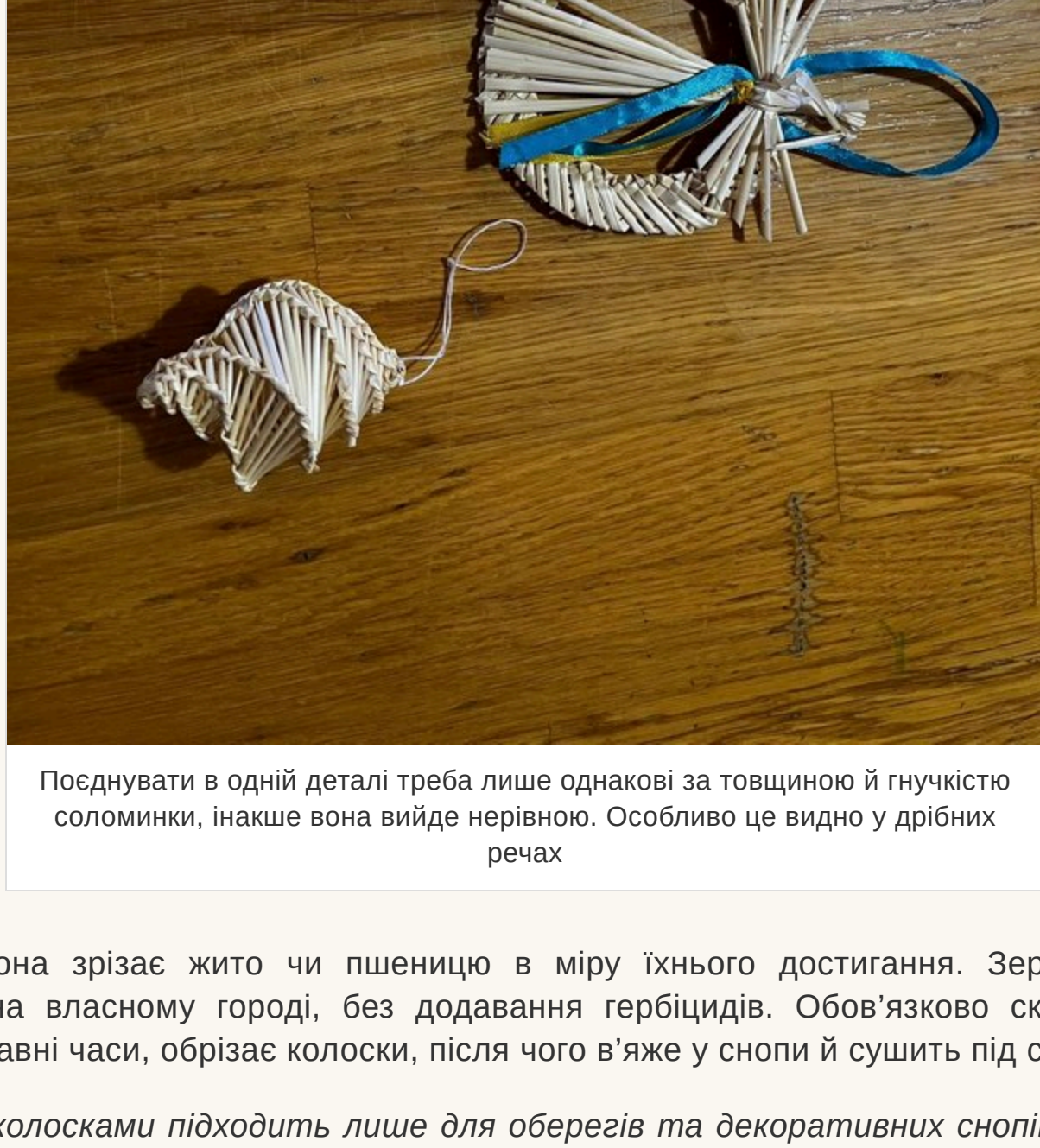
Поєднувати в одній деталі треба лише однакові за товщиною й гнучкістю соломинки, інакше вона вийде нерівною. Особливо це видно у дрібних речах